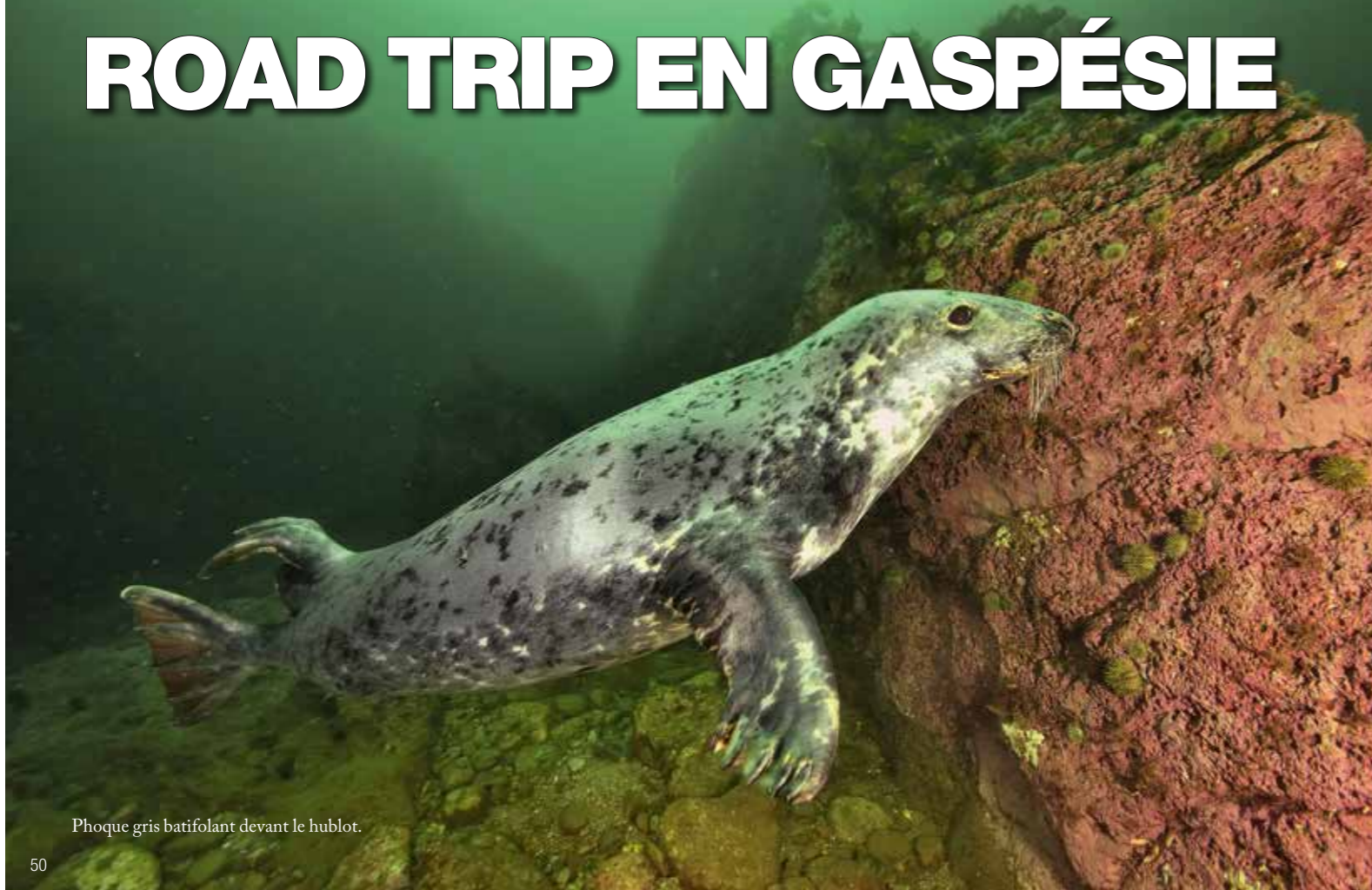
Phoque gris batifolant devant le hublot.