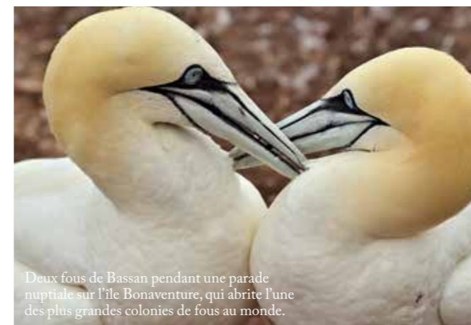
Deux fous de Bassan pendant une parade nuptiale sur l'île Bonaventure, qui abrite l'une des plus grandes colonies de fous au monde.