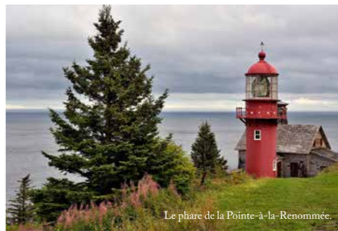
Le phare de la Pointe-à-la-Renommée.

Pardon à mes amis québécois, si à cheval sur les expressions françaises, pour cet horrible anglicisme ! Ce « voyage routier » va donc vous décrire ma semaine passée à traverser la Gaspésie pour atteindre Percé, à l'est de la péninsule canadienne. Cette destination, peu connue des plongeurs, m'a attiré pour diverses raisons. En premier lieu, son caractère insolite, loin des sempiternelles mer Rouge ou Maldives qui, si elles n'en demeurent pas moins des valeurs sûres, font « tirer la plume » au malheureux palmipède photographe et scribouillard qui doit essayer d'en tirer un reportage original. Ensuite, la perspective de se mettre à l'eau, même si elle est froide, avec les deux stars du coin, j'ai nommé Halichoerus grypus et Phoca vitulina concolor , à savoir le phoque gris et le phoque commun, qui se disputent la palme du mammifère marin le plus joueur. Et puis la nature, si sauvage et si belle, même si j'ai raté l'été indien à deux semaines près. Et enfin et surtout, les Québécois eux-mêmes, si agréables, attentionnés, tranquilles (je n'ose pas écrire cool pour la raison citée plus haut) et à la langue et l'accent tellement fleuris.