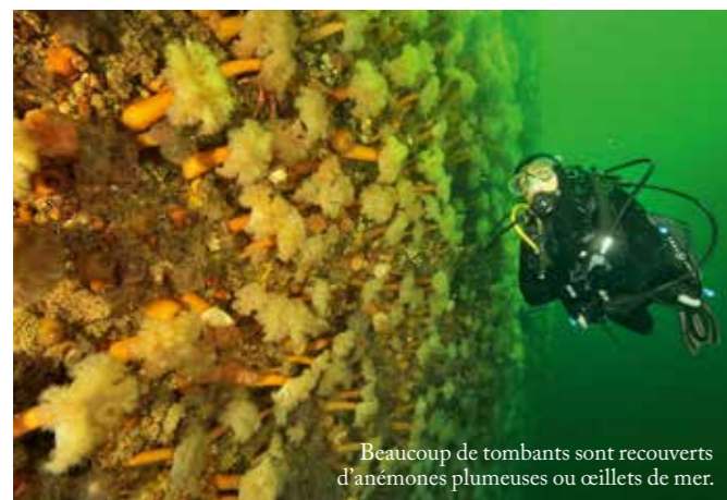
Beaucoup de tombants sont recouverts d'anémones plumeuses ou ceillecs de mer.