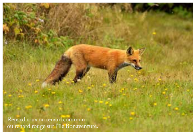
Renard roux ou renard commun ou renard rouge sur l'île Bonaventure.

Le lendemain, le vent ne s'étant toujours pas levé, retour à nos fondamentaux azotés. « Si tu as assez de photos de