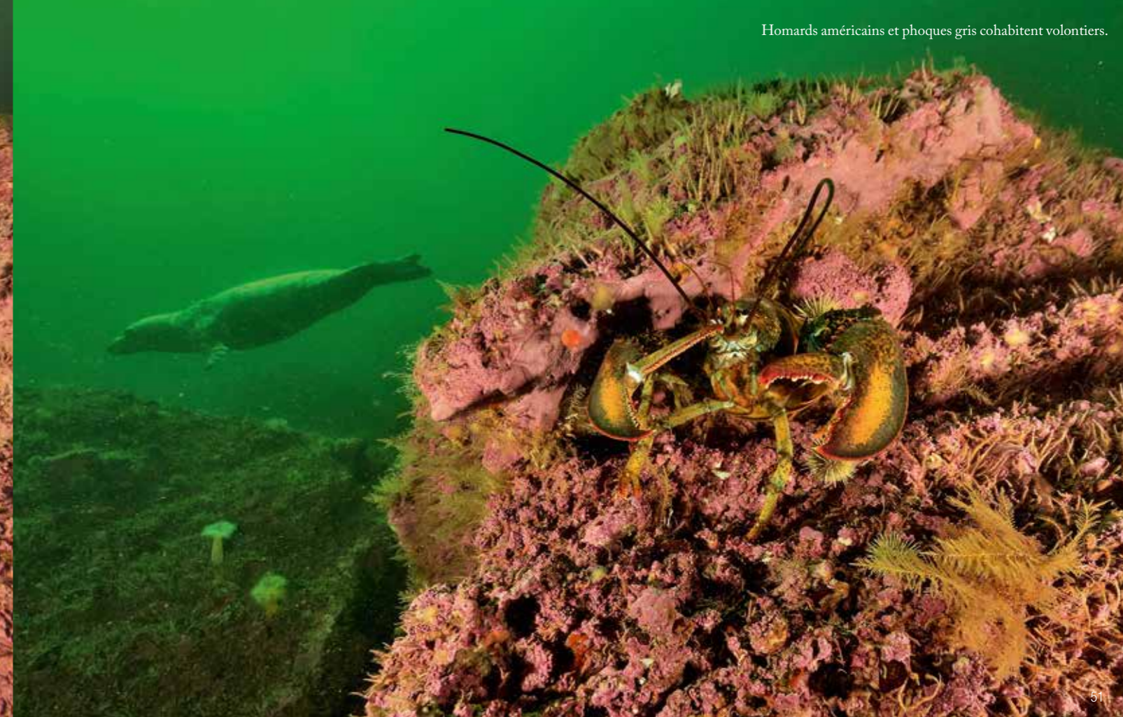
Homards américains et phoques gris cohabitent volontiers.