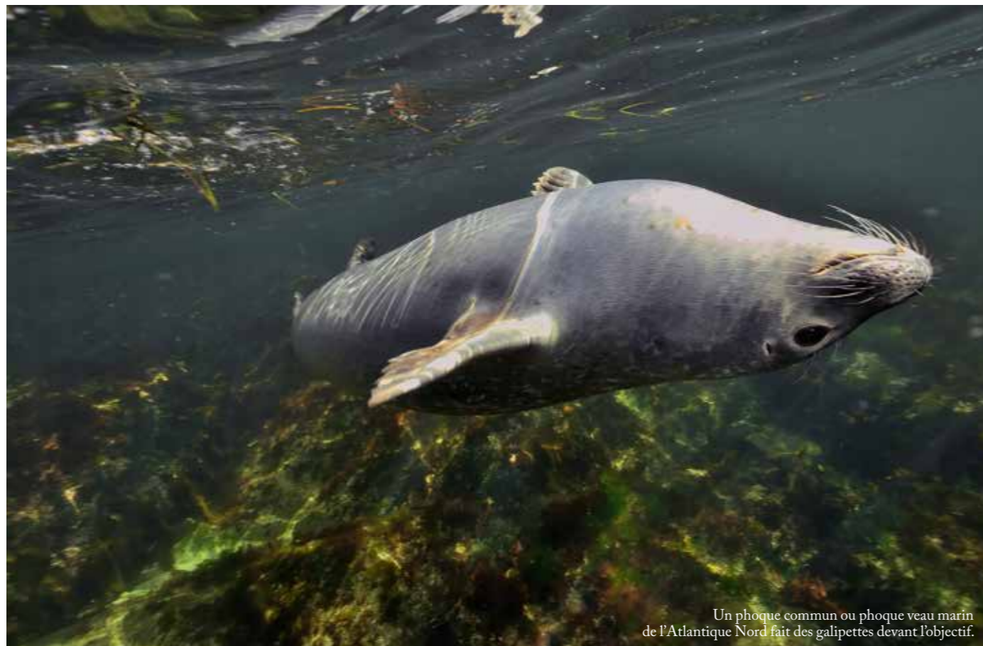
Un phoque commun ou phoque veau marin de l'Atlantique Nord fait des galipettes devant l'objectif.

La douche chaude au centre est plus que bienvenue, mais la douche froide qui l'accompagne (au figuré, celle-ci) me fait grimacer. « Demain, il y aura trop de vent, je ne pense pas qu'on fasse une sortie » m'annonce Steven, avant d'enchaîner : « Mais j'ai un plan B pour vous, si ça vous tente. Dans le parc national Forillon, à deux heures de voiture d'ici, il y a la possibilité de nager en PMT avec les phoques communs. Ils sont plus petits mais encore plus joueurs. Ils viennent vraiment au contact. » Le lendemain, sous un soleil de plomb et sans un souffle de vent (!), me voilà en train de barboter, dûment équipé, dans quelques