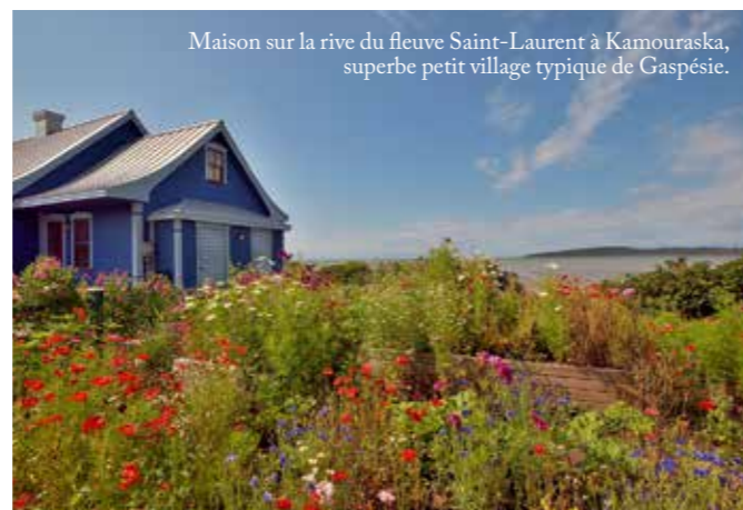
Maison sur la rive du fleuve Saint-Laurent à Kamouraska, superbe petit village typique de Gaspésie.