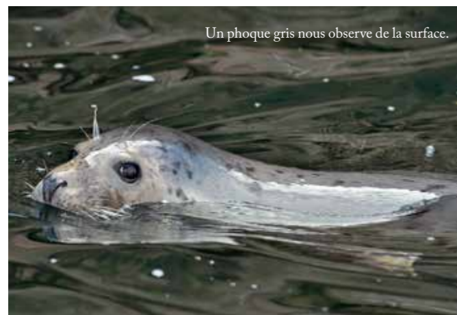
Un phoque gris nous observe de la surface.

Après cinq à dix minutes de navigation sous un soleil de plomb (au moins, il me réchauffera après la plongée), nous voici près de l'île de Bonaventure, sur un site nommé le « Mur noir », qui fait autant la réputation de Percé que le rocher percé qui a donné son nom à la ville. Tout près du bord, quelques phoques gris jouent en se pourchassant ou se reposent allongés au soleil. Le briefing est prometteur. « Quelques précisions : on va plonger le long de cette paroi. À la fin, il y a un éboulis. Il ne faut pas le dépasser. Vous verrez, les phoques sont assez joueurs et viennent toujours dans votre dos. Quand ça se passe bien, ils vous mordillent les palmes. Ce n'est jamais méchant, pas de quoi avoir peur. » Cette plongée tiendra ses promesses, ainsi que la suivante, sur « Le Bilbo », quelques dizaines de mètres plus loin. Les phoques gris passent et repassent autour de notre binôme et prennent effectivement un plaisir évident à venir mordiller nos palmes. Les prendre en photo n'est pas toujours évident et oblige à des contorsions acrobatiques, mais le plaisir de l'interaction avec ces mammifères joueurs est immense. Pour ceux qui l'ont vécu, cela rappelle les jeunes otaries de Californie de la mer de Cortez.