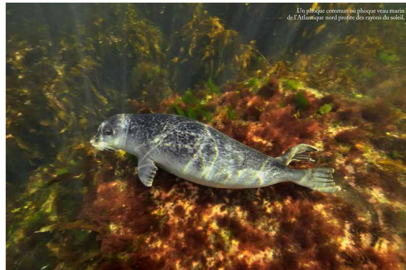
Un phoque commun ou phoque veau marin de l'Atlantique nord profite des rayons du soleil.