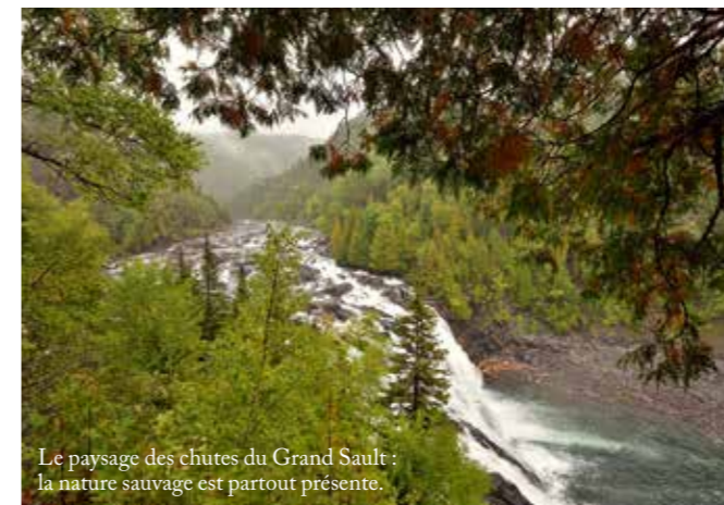
Le paysage des chutes du Grand Sault : la nature sauvage est partout présente.