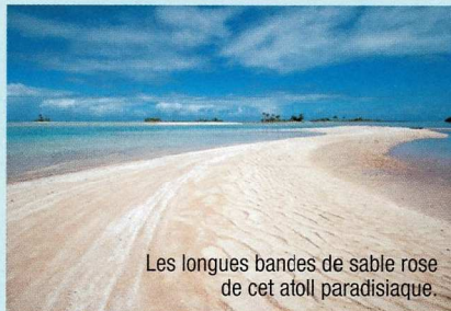
Les longues bandes de sable rose de cet atoll paradisiaque.